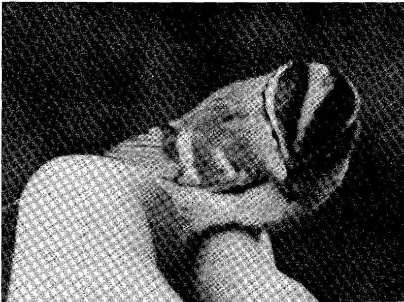
Fig. 1. Pallas' Boszanger Phylloscopus proregulus proregulus , 24 november 1974, Gaasterland Fr. Pallas's Warbler Phylloscopus proregulus proregulus , November 24th 1974, province of Friesland.