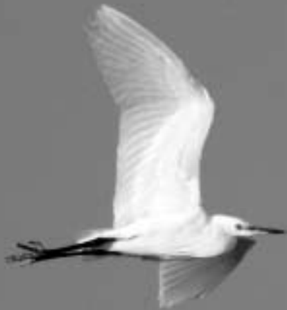
Kleine Zilverreiger , Lentevreugd, Wassenaar, 22 december 2007 (Jan Hendriks)