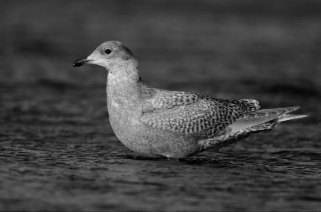
Kleine Burgemeester, strand Katwijk aan Zee, 1 december 2007 (Menno van Duijn)