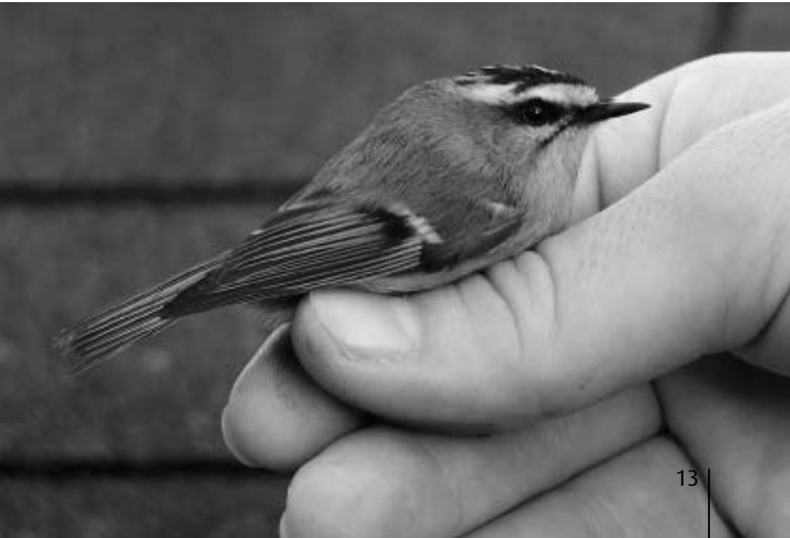
Vuurgoudhaan, Vogelringstation (VRS) Meijndel, 30 september 2004 (Sander Pieterse)