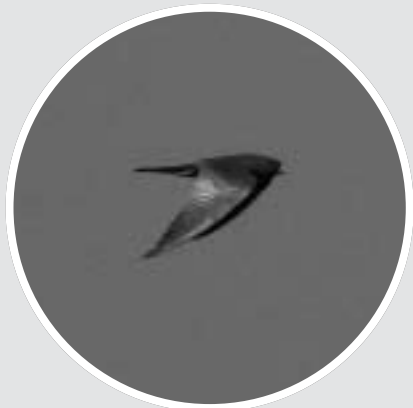
Roodpootvalk , adult ♂, Lentevreugd, 11 mei 2008 (René van Rossum)