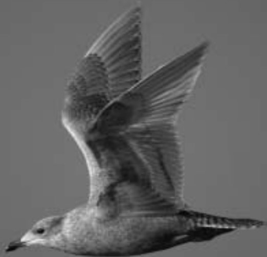
Kleine Burgemeester, strand Katwijk aan Zee, 1 december 2007 (Peter Lindenburg)