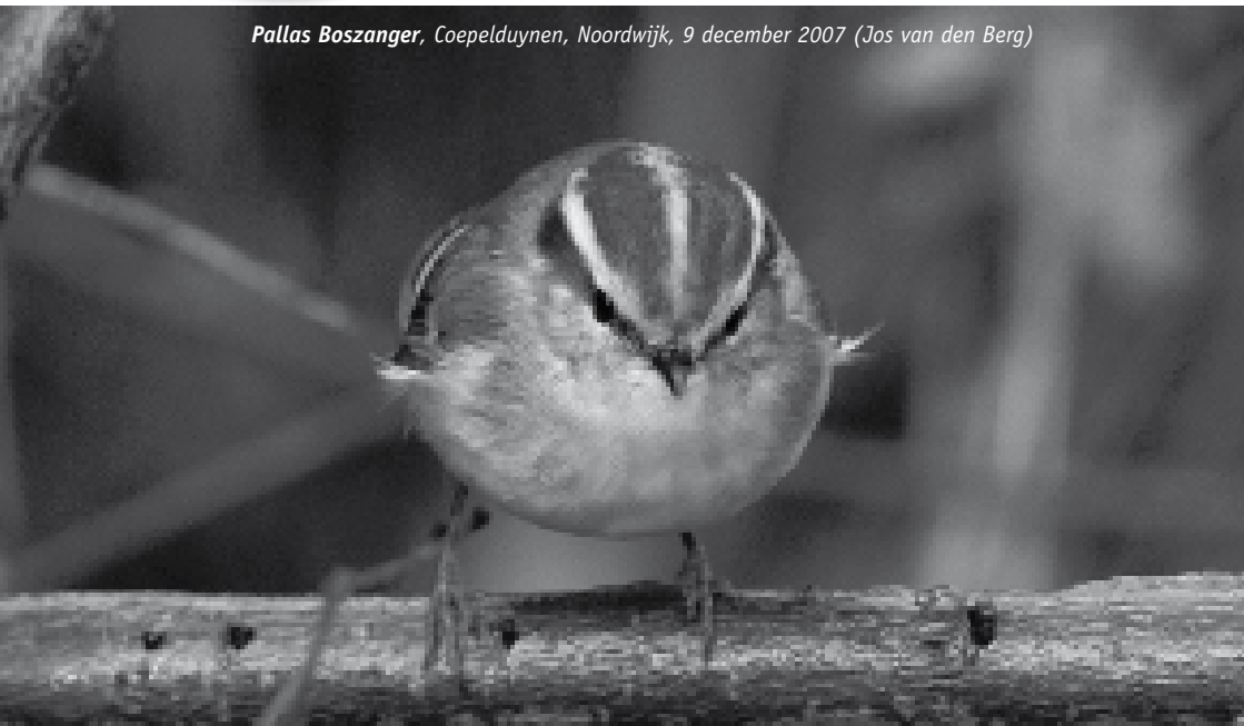
Pallas Boszanger, Coepelduynen, Noordwijk, 9 december 2007 (Jos van den Berg)