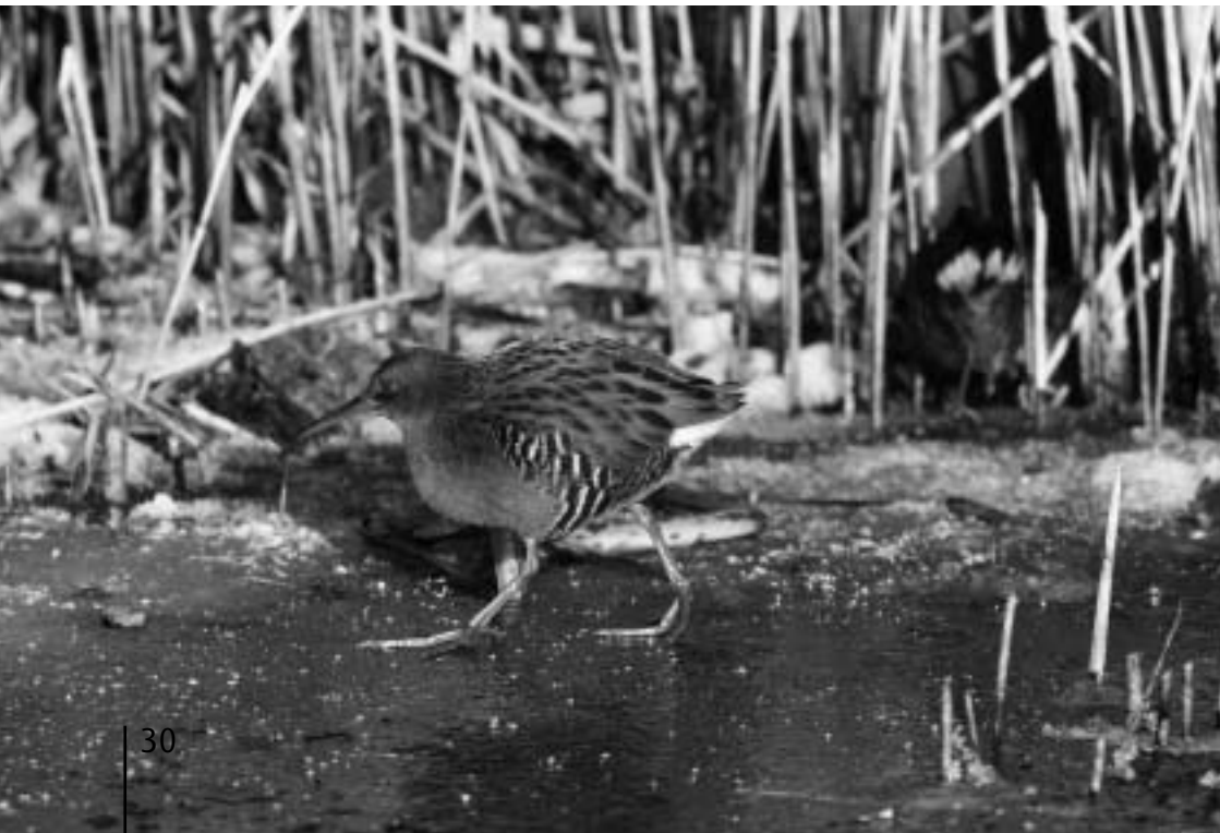
Watterrallen, Lentevreugd, Wassenaar, 22 december 2007 (Jan Hendriks)