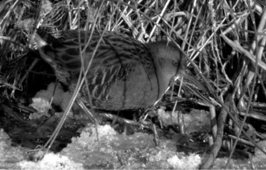
Watterral, Lentevreugd, Wassenaar, 22 december 2007 (Luuk Punt)