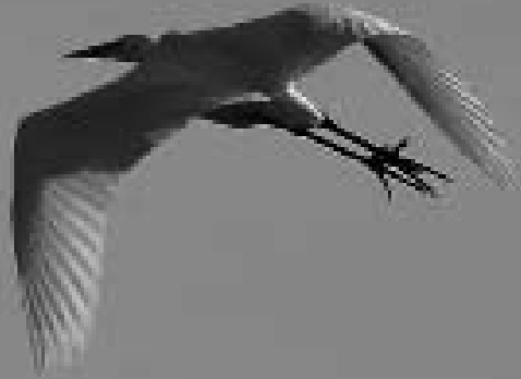
Grote Zilverreiger , Wassenaarseweg nabij Vliegkamp Valkenburg, 3 februari 2008