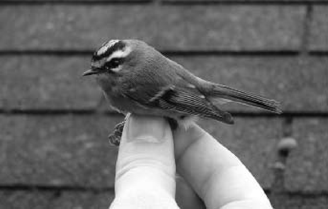
Vuurgoudhaan, Vogelringstation (VRS) Meijndel, 13 oktober 2004