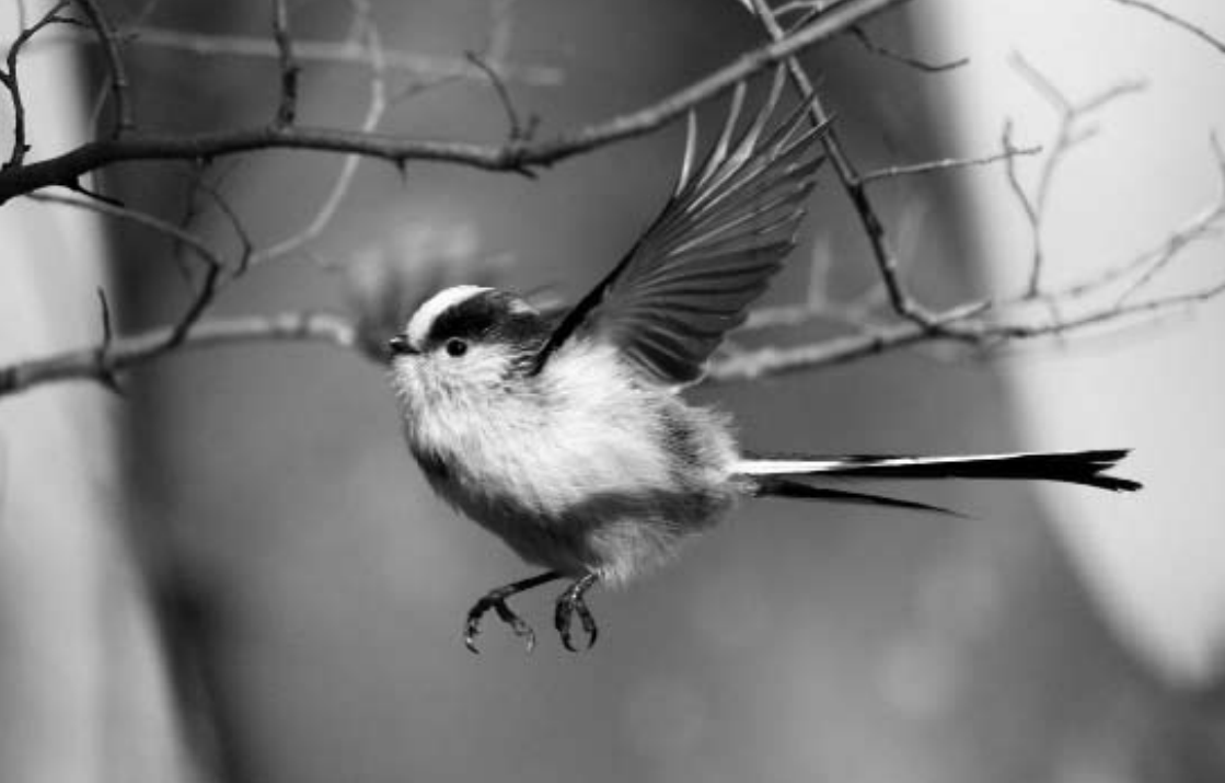
Startmees , Panbos, Katwijk, 15 februari 2008