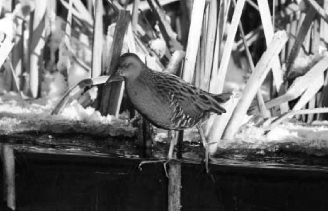
Waterrallen, Lentevreugd, Wassenaar, 22 december 2007