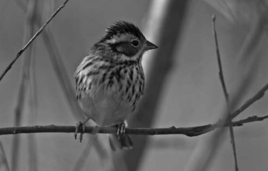
Dwerggors, 's-Gravendijk, Katwijk, 26 januari 2008