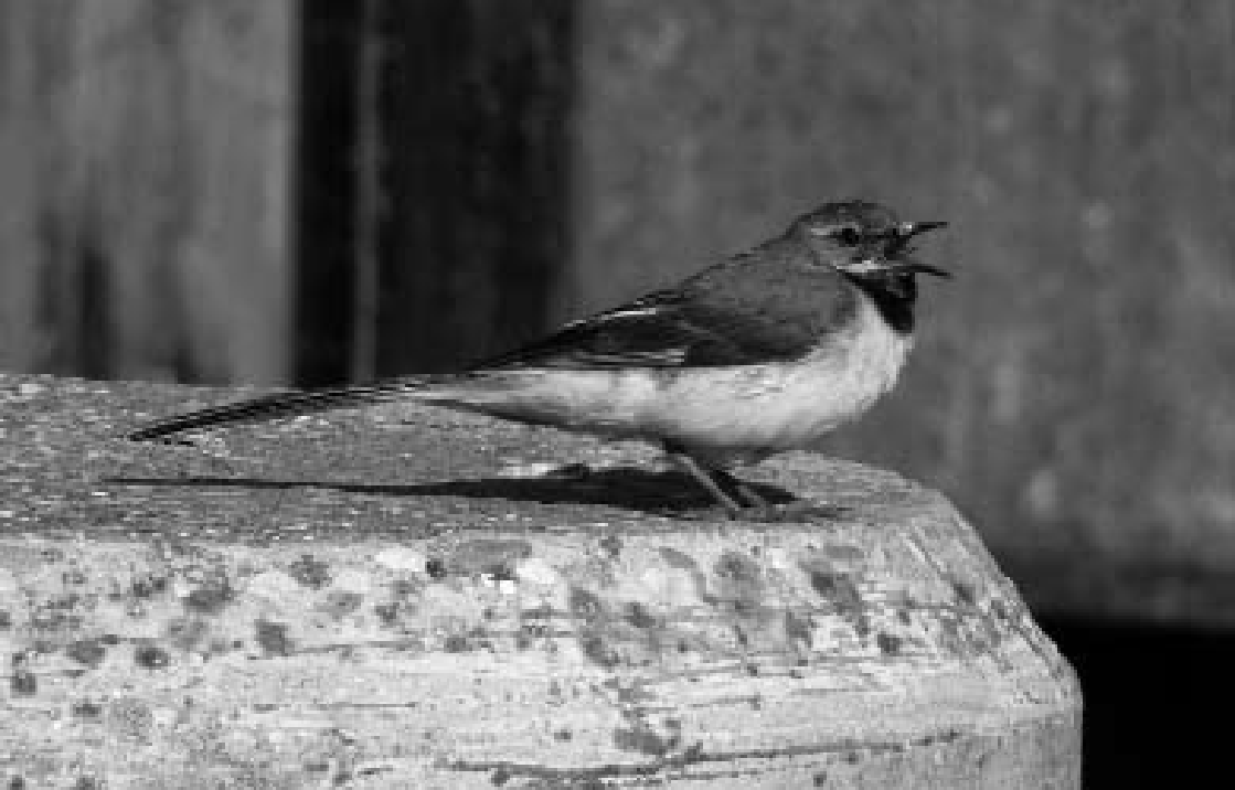
Grote Gele Kwikstaart ♂, De Wollebrand, Naaldwijk, gemeente Westland, juli 2006 (Ton van Schie)

vogel gevangen met een Deense ring, een noviteit voor Nederland. Tot op heden is er nog geen reactie uit Denemarken ontvangen.