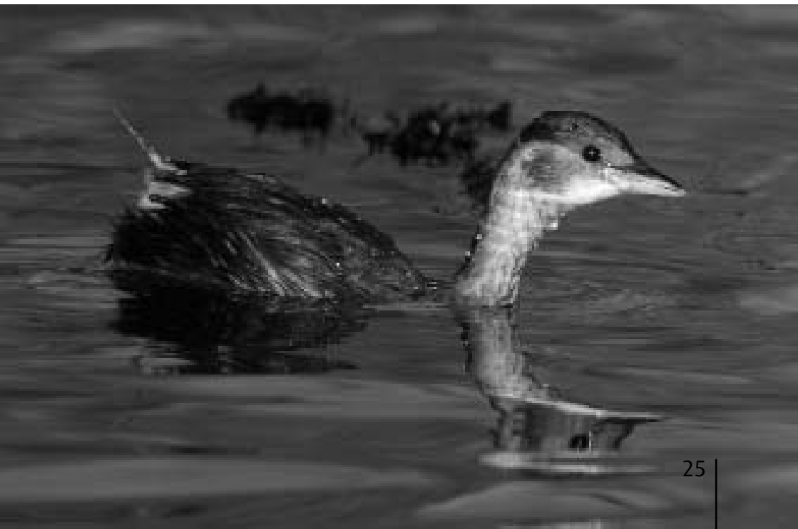
Dodaars, Zwarte Pad, nabij de Estec, Katwijk, 14 december 2007 (Arnold Meijer)