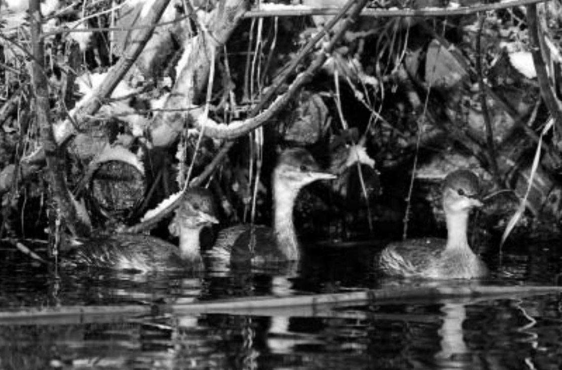
Drie Dodaars, Zwarte Pad, nabij de Estec, Katwijk, 20 december 2007 (Arnold Meijer)