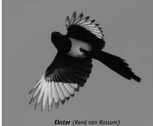
Ekster (René van Rossum)

In onderstaande tabel zijn de resultaten weergegeven. Tevens zijn de broedvogelgegevens opgenomen van 1990. In dit jaar heeft hier eveneens een volledige broedvogelkartering plaatsgevonden. In de tussenliggende jaren zijn tijdens het broedseizoen onregelmatig territorium-indicerende waarnemingen verzameld. Laatstgenoemde gegevens staan in de tabel vermeld wanneer het aantal territoria die van 1990 en 2007 overtreffen. Nieuwkomers ten opzichte van 1990 zijn Sperwer, Groene Specht, Halsbandparkiet en Vink. Braamsluiper en Grauwe vliegenvanger zijn sinds 1990 niet meer tot broeden gekomen. Van Merel en Huismus is in 2007 geen betrouwbaar beeld verkregen, respectievelijk door het ontbreken van vroege ronden en het niet meenemen van de bebouwing van het verzorgingstehuis in het onderzoek. De afname van Houtduif, Zanglijster en Roodborst is deels te verklaren uit de inventarisatietechniek. In 1990 werd nog niet gewerkt