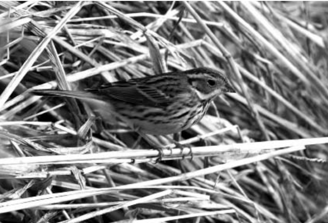
Dwerggors, Gravendijk, Katwijk, 2 februari 2008 (Hans Groen)