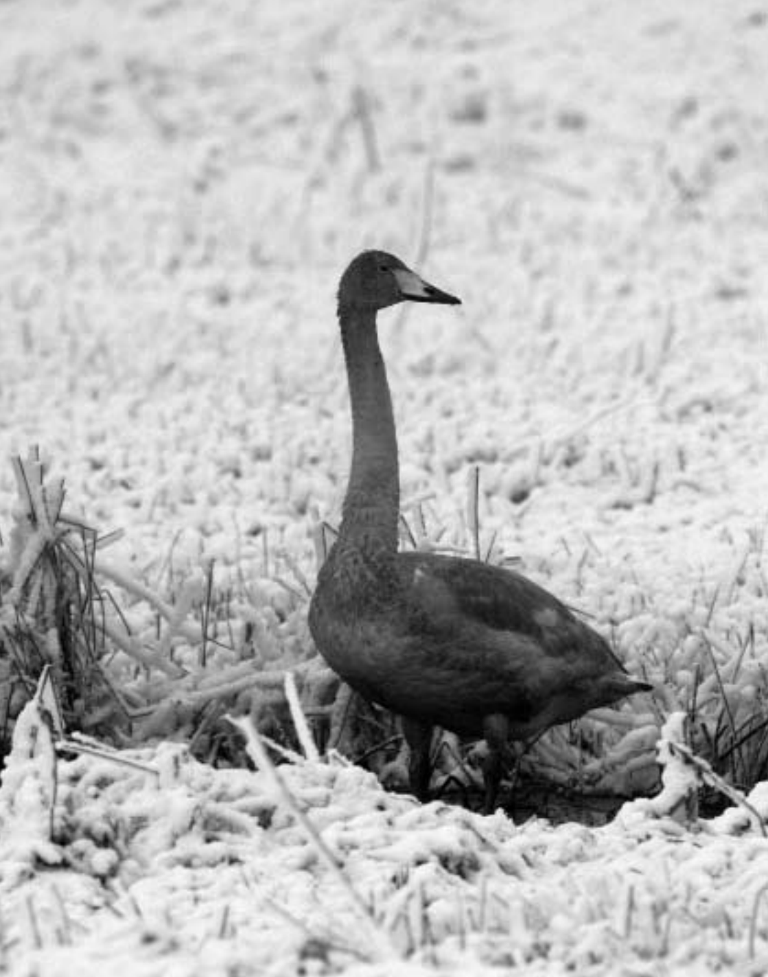
Wilde Zwaan onv, Lentevreugd, Wassenaar, 21 december 2007 (René van Rossum)