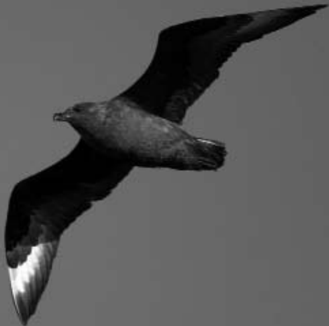
Grote Jager, strand Katwijk aan Zee, 3 december 2007 (Menno van Duijn)